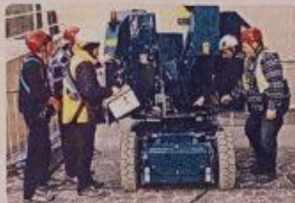
Iniziativa e partecipazione all'opera durante un corso di formazione

Il vasto panorama dei cantieri sul territorio regionale vede realtà di grandi dimensioni, con strutture organizzative dedicate alla sicurezza, accanto a cantieri di dimensioni minori, in cui non sempre si rileva la stessa attenzione nella gestione degli accorgimenti relativi alla tutela della salute dei lavoratori. Edilizia Sicura in questo senso oltre a sensibilizzare gli operatori sul ri-