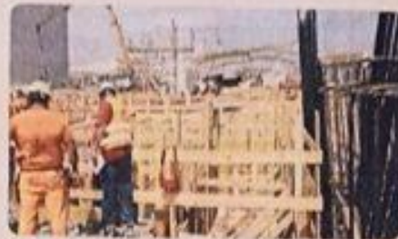
Assistenza tecnica e formazione on the job nei cantieri EXPO

Parliamo da un esempio in grado di rendere al meglio il valore e la professionalità messe in campo da CPT Milano: onestamente al personale di Inail Direzione Regionale Lombardia, questo realtà ha garantito nel progetto EXPO un presidio costante di assistenza tecnica alle imprese per l'attuazione degli adempimenti prevenzionistici, intervenendo capillarmente laddove fossero ravvisate delle lacune nell'attività di formazione on the job delle maestranze e dando il via a un'attività di monitoraggio comportamentale per valutare l'attuazione della buona prassi di prevenzione. Risultato: notevole contenimento dell'andamento infortunatico (se confrontato con quello di altri cantieri milanesi di media importanza anche se non di simile complessità) e acciuffamento della consapevolezza dei valori di "precauzione e valutazione del rischio" dai singoli individui (3.406 i lavoratori coinvolti). CPT, organismo paritetico costituito da Assimpredil ANCE e Fiesad UIL, è nato per